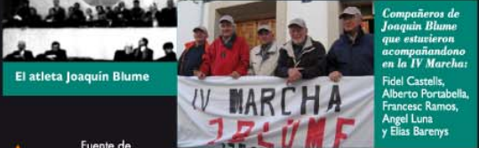
El atleta Joaquín Blume

Compañeros de Joaquín Blume que estuvieron acompañando en la IV Marcha: